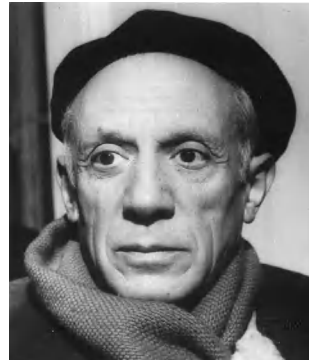
Pablo Picasso (1881-1973)