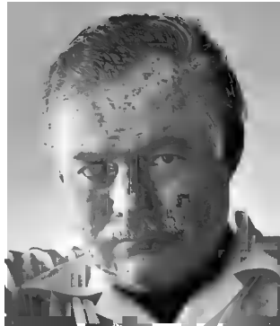
Ernest Hemingway (1899-1961)