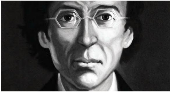
Padre Félix Varela Morales

siempre hasta su deceso. Sus enseñanzas éticas no solo se encuentran en las Cartas a Elpidio , sino, en primer lugar, en su propia vida.