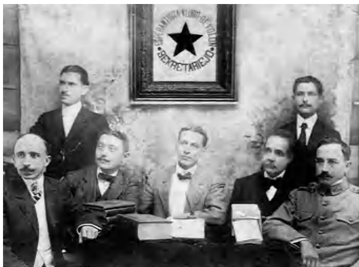
Grupo espiritista de Colón Matanzas, 1916

El Espiritismo Cruzado –de cruce o “cruzao”, como también se le conoce– se nutre de una buena variedad de aportes de las religiones africanas –Santería y Palo Monte–; se vincula a representaciones católicas sin dejar fuera elementos simbólicos de la religiosidad popular y la de nuestros primeros pobladores. Los aportes africanos están representados no solo por atributos religiosos que tipifican esas expresiones, sino también mediante muñecos de trapo negros que representan los ancestros. Santos e indios son representados simbólicamente por imágenes de yeso; las de los indios se corresponden con difundidas por la cinematografía estadounidense.