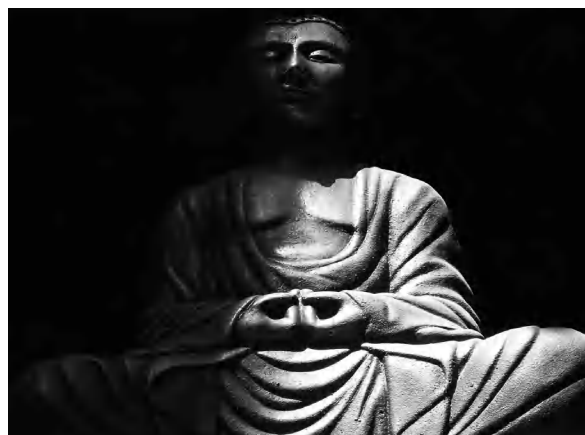
Sutra del Loto

El contexto socioeconómico, tanto nacional como internacional, propicia que esta práctica no se comporte como un hecho aislado, sino que se inserte en el diverso panorama de prácticas y creencias que ha proliferado en los últimos años en la realidad social cubana, dada la incertidumbre e inseguridad producida por la crisis.