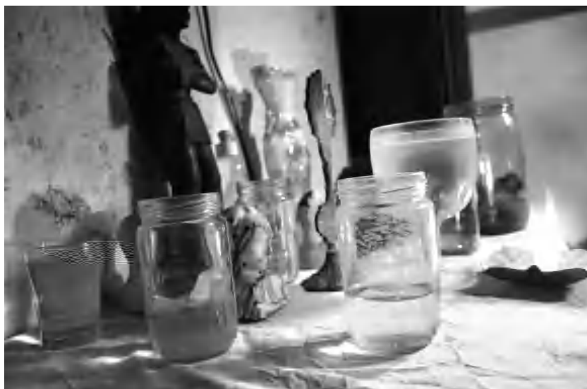
Altar espiritista o bóveda espiritual

festaciones tanto en el nivel individual como en el grupal, y que el ejercicio de hacer la caridad ocupa en ellos un lugar sin precedentes. Se trata de hacer el bien de forma gratuita, a través de despojos o santiaguaciones, lecturas de oraciones religiosas, consejos, etc. Se puede afirmar que la caridad constituye la modalidad del espiritismo que más se ejerce en la Isla.